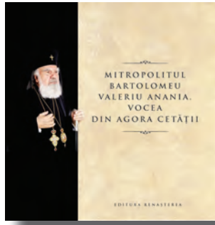
Mitropolitul Bartolomeu Valeriu Anania. Vocea din agora cetăţii, Editura Renaşterea, Cluj-Napoca, 2025

Suflete, te-am luat aici cu mine, în singurătăţile senine, să-nchinăm Stăpânului din stele zvon din zvonul cânturilor mele.” 6