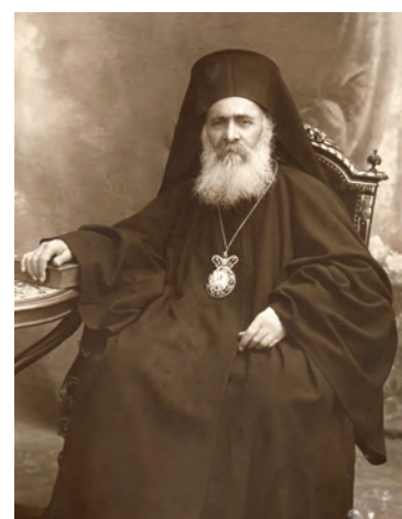
Patriarhul Ecumenic Vasile al III-lea al Constantinopolului.

Anexă. Tomosul Patriarhului ecumenic Vasile al III-lea privind recunoașterea rangului de Patriarh al României și a ridicării Bisericii Ortodoxe Române la demnitatea de patriarhie, Constantinopol, 30 iulie 1925” 11 .