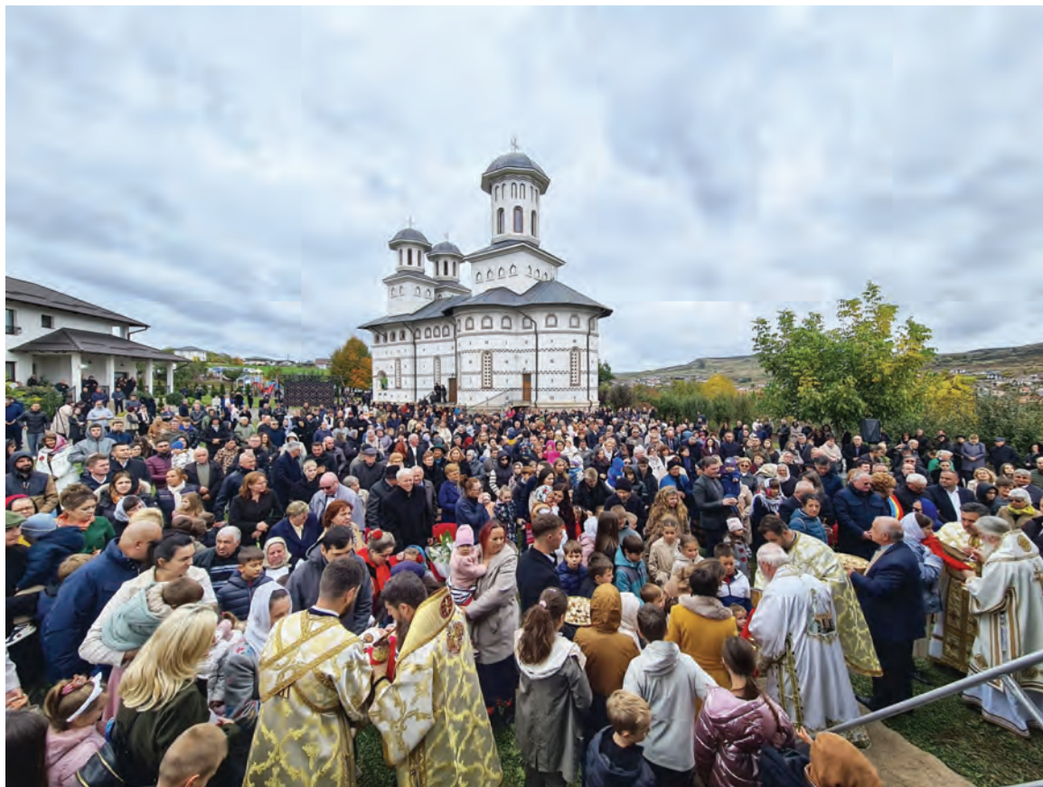
Împărțirea credincioșilor în timpul oficierei Sfintei Liturghii prilejuate de sfințirea Bisericii „Sfinții Apostoli Petru și Pavel” din cartierul clujean Valea Chintăului. 12 octombrie, 2025.