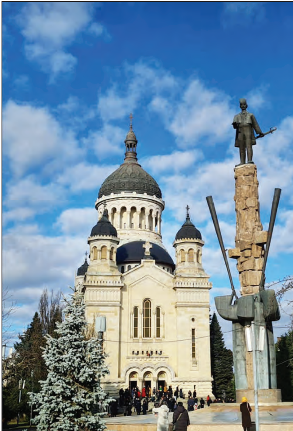
Catedrala Mitropolitană din Cluj-Napoca