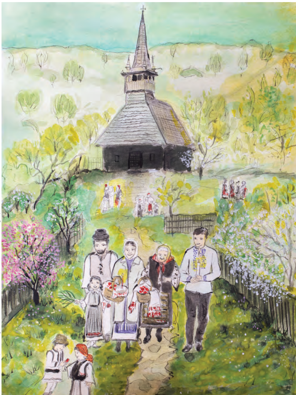
Familie de Paști, tempera realizată de Mirela-Niculina Lupușan.