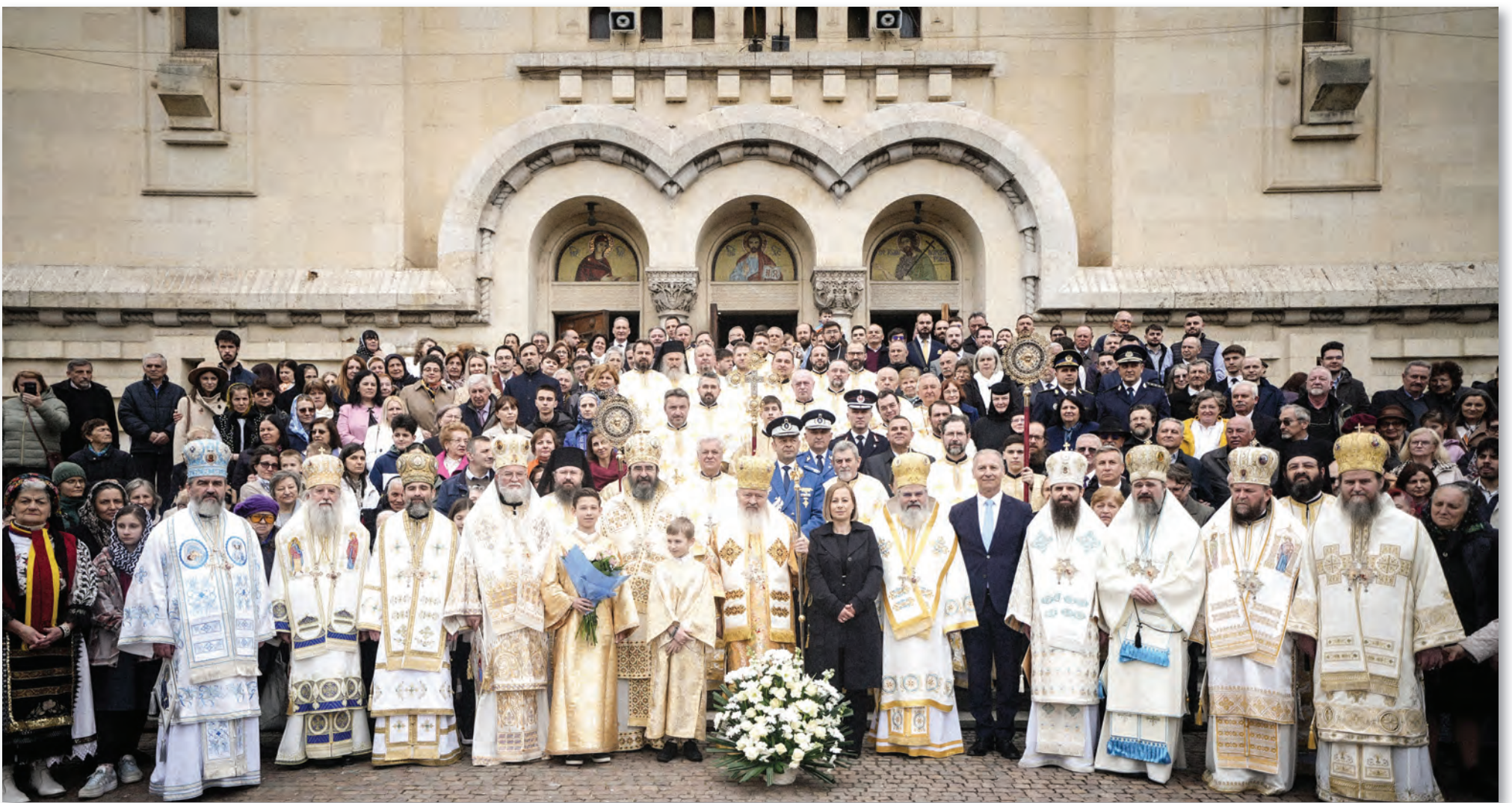
Înaltpreasfințitul Părinte Mitropolit Andrei, înconjurat de ierarhii participanți la Hramul Mitropoliei Clujului, Maramureșului și Sălajului, clerici, autorități civile și militare locale și credincioși, în fața Catedralei Mitropolitane din Cluj-Napoca, Bunavestire, 25 martie 2026.